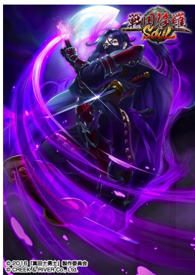
【覚醒】 伊賀流・霧隠才蔵◆忍(☆5)