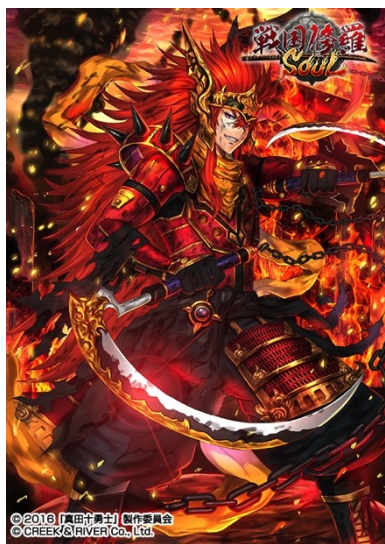
【覚醒】 甲賀流・猿飛佐助◆忍(☆5)