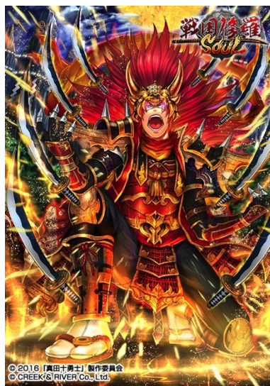
【墮天】 真田十勇士・猿飛佐助◆忍(☆5)