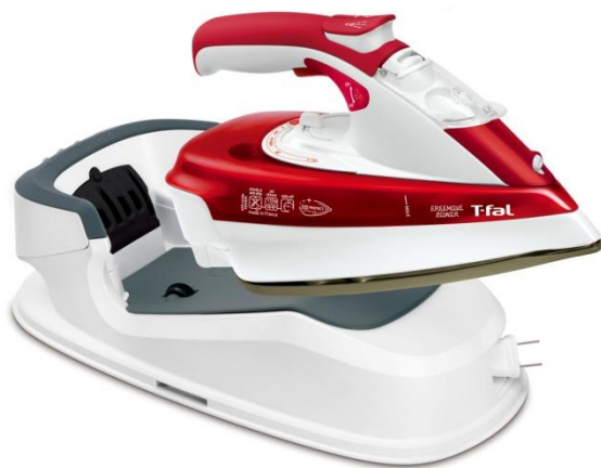
【フリームーブパワー 9985】