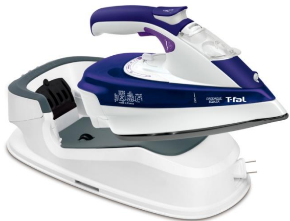
【フリームーブパワー 9980】