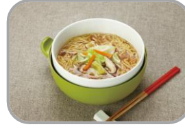
ラーメン (具材入り)