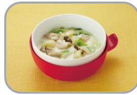
鶏と白菜の クリームシチュー