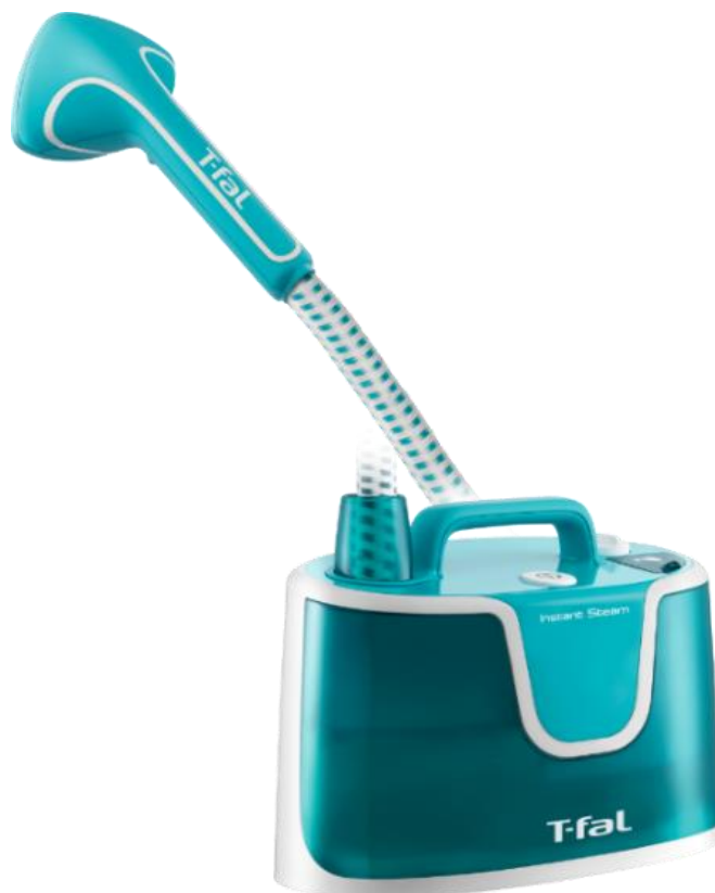
インスタントスチーム 3320

【インスタントスチーム】は、お出かけ前に衣類を簡単にリフレッシュできるほか、洗濯やアイロンがけが難しいカーテンや寝具などの大物のケアに最適です。