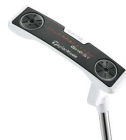
「TOUR PREFERRED® FORGED MILLED GHOST」シリーズ (2012年4月発売予定)

日本オリジナルモデルとして展開される『TOUR PREFERRED® FORGED MILLED GHOST』は、4回の鍛造プロセスを経て成形した軟鉄素材に、精密なミルド加工で細部を仕上げたフォージド&ミルド製法パターです。フェース面にはディープミルド加工を施し、軟鉄特有のしっかりした打感を保持しつつも、柔らかい打感を実現しました。さらに新形状の可変ウエイト、「アジャスタブル・ソール・ウエイト」を搭載したことでソール形状に影響を与えることなく、重量調整を可能にしました。