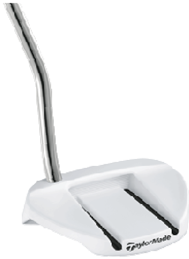
MANTA GHOST Double Bend