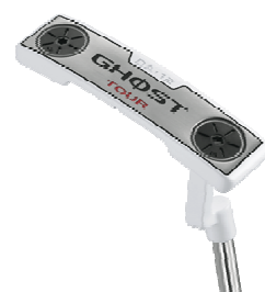
「GHOST TOUR」シリーズ (2012年4月発売予定)

ツアー仕様モデルとして2010年12月より展開してきた『GHOST TOUR』シリーズをリニューアル。DA-12/FO-72/FO-74/MA-81のラインナップに加え、新たにCORZAをシリーズに追加し、一層ラインナップが拡充しました。さらに、全モデルに「アジャスタブル・ソール・ウエイト」を搭載し重量調整を可能にした他、フェースインサートには高い順回転性能を持つ「PURE ROLL Ti(チタリウム)」を採用、優れた転がりを提供します。