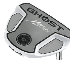
「MANTA GHOST」 (2012年4月発売予定)

トラディショナルシェイプと高慣性モーメント、高いアライメント性能を実現した『MANTA GHOST』は従来のフォンタナのようなセンター形状を採用、クラウン部分に溝状のサイトラインを施し、高いアライメント性能を実現。さらにアルミニウムボディにタングステンを組み合わせた高慣性モーメント形状と「アジャスタブル・ソール・ウエイト」が安定性の高いパッシングを可能にします。