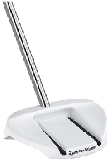
MANTA GHOST Center Shaft