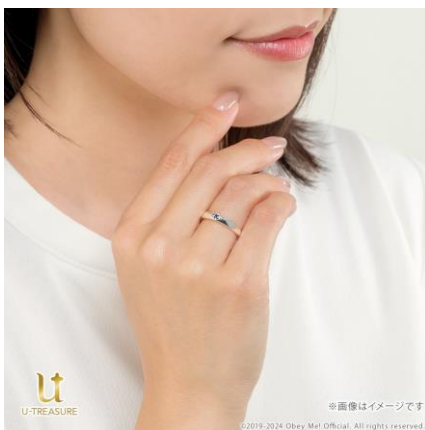
シルバー-925 着用イメージ