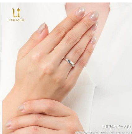
シルバー-925 着用イメージ