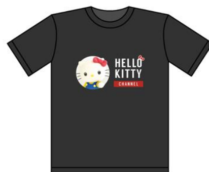
ハローキティチャンネルオリジナルTシャツ イメージ

キャンペーンページ： https://www.kittyhappybirthday.jp/