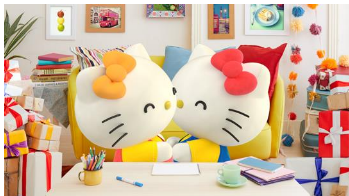
「キティとミミィがいつまでも仲良くいれる魔法」のプレゼントにキティとミミィがハグ