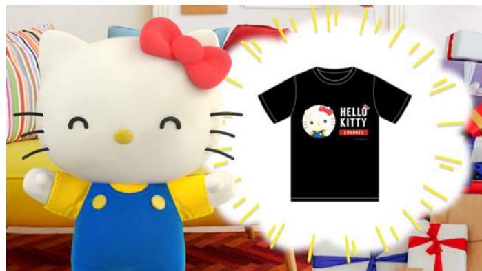
キティからみんなへの逆プレゼントとして、プレゼントキャンペーンの実施を発表