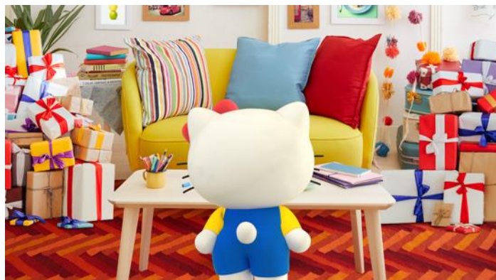
空想プレゼント「ポップコーンマシン50台」に、おしりをフリフリして踊り出すキティ