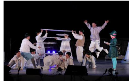
「東京キャラバン the 2nd」静岡パフォーマンスの様子