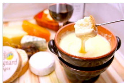
「チーズ料理新業態」