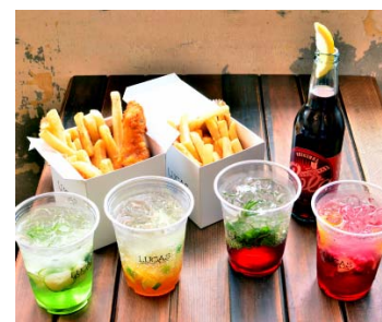
「ルカス フライドフードアンドソーダ」 (7階)