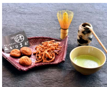
「あかりまど カフェスタンド」 (5階)

また、5～7階の各フロアにもカフェを設置。「HMV&BOOKS TOKYO」で販売する本や雑誌の持ち込みが可能なほか、テイクアウトしたドリンクを片手に、フロアで開催されるイベントをお楽しみ頂けます。