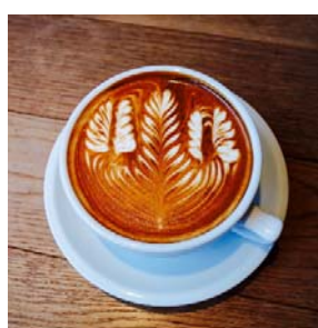
「ストリーマー エスプレッソ」 (6階)