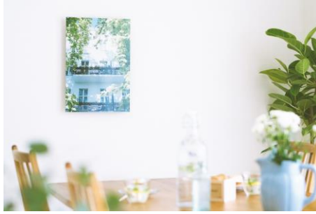
インテリア雑貨をつくる 「WALL DECOR」