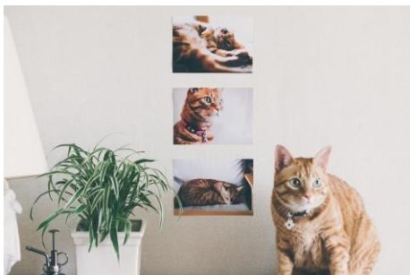
プリントする 「スマホ・デジカメプリント」