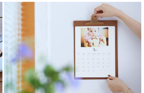
カレンダーをつくる 「壁掛けカレンダー」