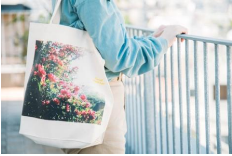
グッズをつくる 「フォトグッズ トートバッグ」