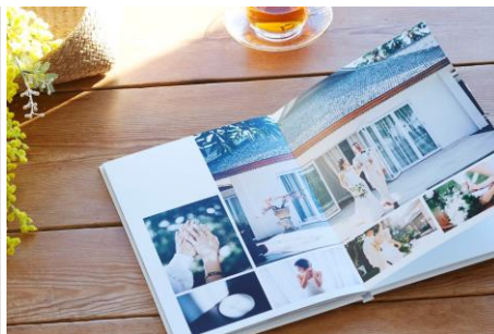
アルバムをつくる 「フォトブック ハードカバー」