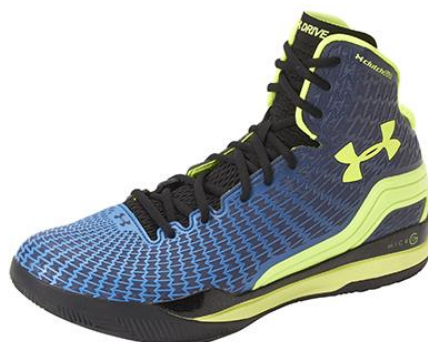
『UAクラッチフィット ドライブ』