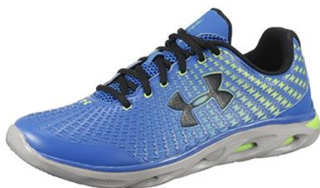
『UAスパイン クラッチ』

株式会社ドーム（本社：東京都品川区、代表取締役：安田秀一）は、「アンダーアーマー（UNDER ARMOUR）」ブランドから、あらゆる動作において第二の皮膚のように柔軟に足にフィットする新テクノロジーを搭載したフットウェア『UAクラッチフィット』シリーズ、8つの製品（※次頁参照）をアンダーアーマー取扱店にて順次発売いたします。