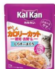
しらす入りまぐろ