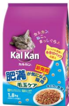
肥満が気になる猫用 毛玉ケア まぐろと野菜味