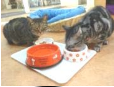
わが社のペット 権之助（左 オス 6歳）とウイスキー（右 オス 6歳）