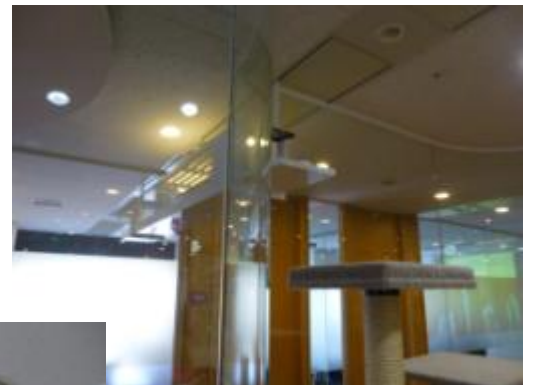
キャットルーム側からみたトンネル（上図）