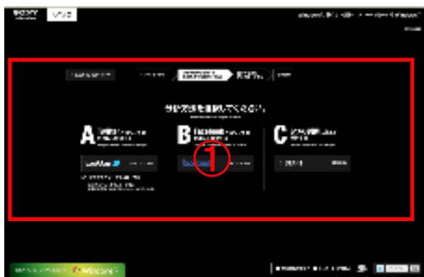
①「Twitter」、「Facebook」、「5つの設問回答」から、一つ分析方法を選択