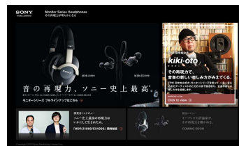
【スペシャルサイトTOP画面】

スペシャルサイトでは、原音を忠実に再生するモニターヘッドホンシリーズとして、録音スタジオやポストプロダクションスタジオなどでサウンドクリエイターが使用することも視野に入れたスタジオモニターフラッグシップモデル『MDR-Z1000』、アウトドア用ヘッドバンド型の新シリーズ「ZXシリーズ」、そして密閉型ステレオイヤークラスパー「MDR-EX1000」をはじめとする「EXモニター」シリーズの開発者インタビューや、製品レビューのコンテンツも展開しております。