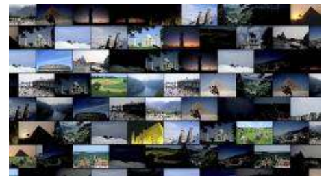
『スクリーンセーバー例』

※このスクリーンセーバーの使用は、あくまでユーザー個人の私的利用の範囲内とします。 ※検索キーワードの設定には、ソニーは一切関与いたしません。