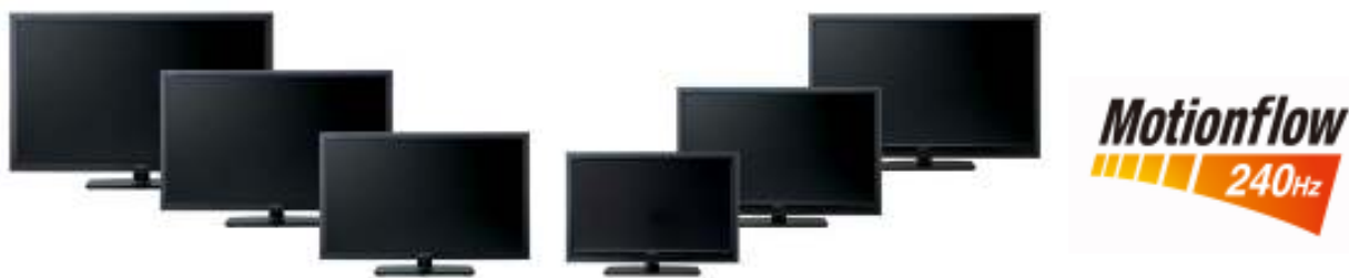
液晶テレビ<ブラビア> W5/F5シリーズ