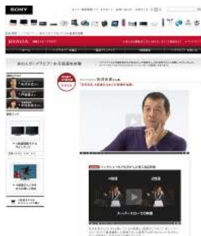
<矢沢さんの4倍速体験ムービーイメージ図>