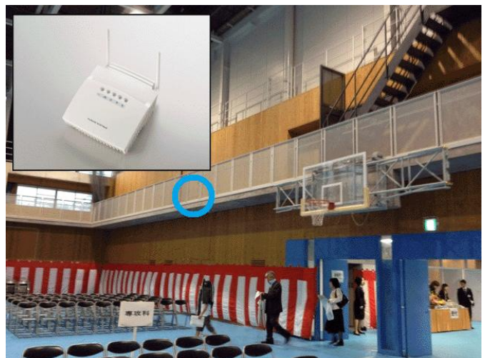
【エアサイネージサーバ 入学式風景】