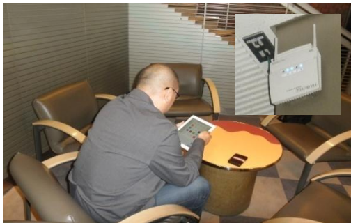
アクセスポイント ロビー設置

フルノシステムズの提供する無線LAN製品「UNIFAS/ACERA」は、今回の事案のようにデータセンターにて運用することが可能であり、ユーザー様の要望に応じて柔軟に対応できるカスタマイズ性も注目され、業務用無線LANインフラからフリーWi-Fiまで幅広く対応が可能です。スマホやタブレット端末の活用するシーンが増えてくるにつれ、今後、NTTネット様が提供している「無線LANクラウドソリューション」に、当社の無線LANシステムが採用され、多くのみなさまに利用される機会が増えてくるものと期待しております。