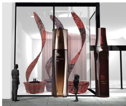
■ 飛び出すオブジェが地上にも出現