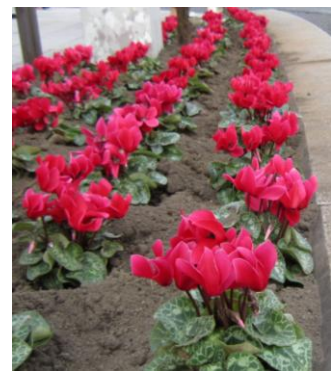
■ 銀座のメインロードを赤い花が彩ります