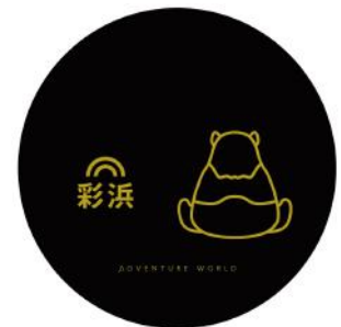
丸盆：「彩浜」デザイン（黒）