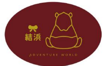
弁当箱：「結浜」デザイン（赤）