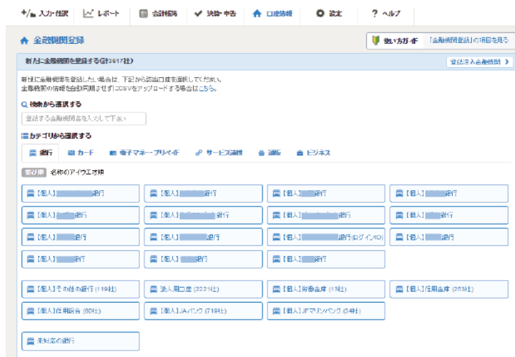
<金融機関登録画面>

銀行、クレジットカード、電子マネー、Amazon や楽天などの通販サイトなど、連携する金融機関から日々の出入金明細や利用履歴を自動で取得します。不動産オーナーにおいては、銀行口座との連携で家賃収入の履歴が毎月自動で取得されるため、売上の入力作業が激減します。