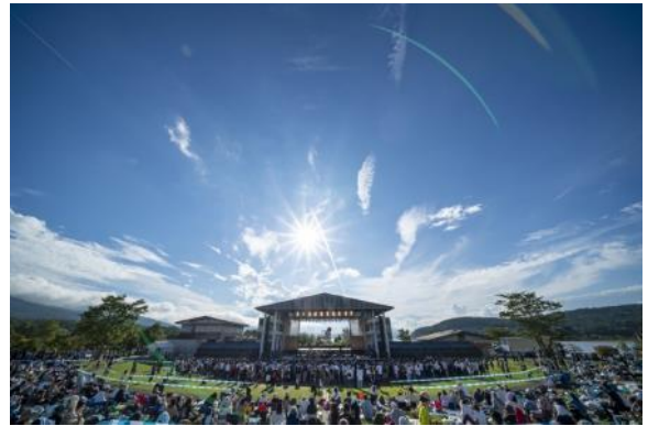
「Mt.FUJIMAKI 2019」より