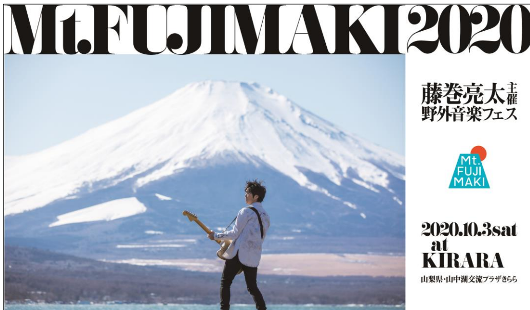
「Mt.FUJIMAKI 2020」メインビジュアル