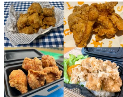
貸出画像「G球場からあげ祭りに出店する各店舗のからあげ(イメージ)」