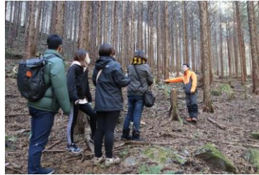
森林ガイドウォーク