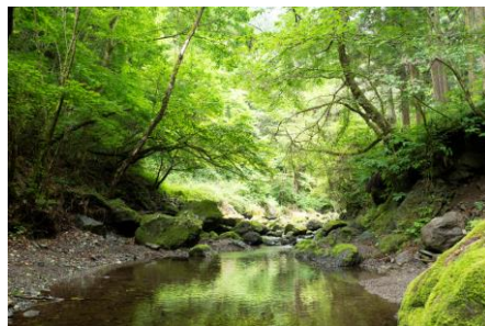
奥多摩町・海沢地区