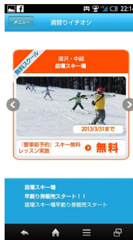
②お得なイチオシクーポン