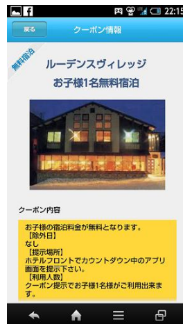
⑤クーポン取得しカウントダウン