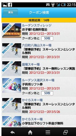
④クーポン一覧から特典選択