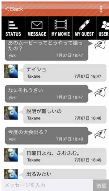
図3 メッセージ画面