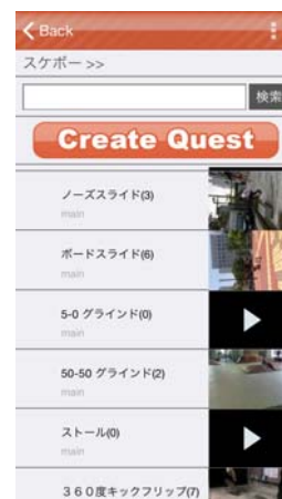
図1 クエストの一覧画面