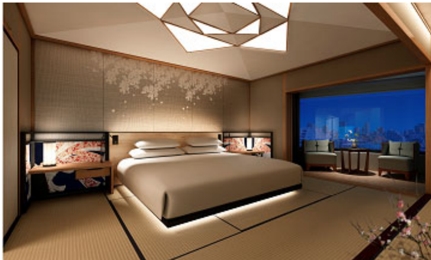
リニューアル後の和室イメージ(80㎡)

2018年12月に創業90周年を迎えた日本美のミュージアムホテル、ホテル雅叙園東京(運営:株式会社目黒雅叙園 / 所在地:東京都目黒区)では、6階に位置する和室(計12部屋)を改修し、7月4日(木)にリニューアルオープンすることとなりましたのでお知らせいたします。