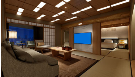
リニューアル後の和室イメージ(120㎡)

施工箇所: 6階 和室 12部屋 (80㎡キング6部屋 / ツイン4部屋、120㎡ キング2部屋)