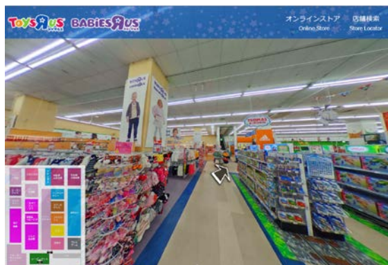
「360°パノラマコンテンツ」イメージ

商品購入に迷いがある場合に、一旦、お気に入りやカートに商品を入れておくことがあります。このような場合に、オンラインストアのマイアカウントのログイン時において、値下げ情報をタイムリーにお知らせするのが「カートアラート」です。11月8日(火)より導入した「カートアラート」は、人気商品のお買い得時の購入支援を実現し、お客様により良いサービスを提供してまいります。