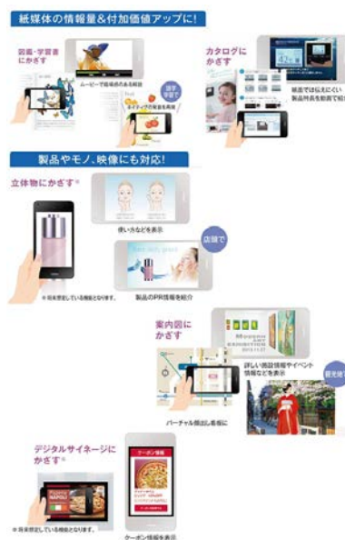
【スマホ de かざす UI® の画像識別方式】