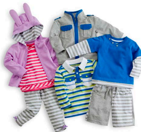
【「UVコレクション」の一例】

日本トイザラスでは、今回初めてプライベートブランドで紫外線対策ウェアを導入し、暑い夏の日差しからお子様を守りたいというお客様に、お買い得感のある価格でご提供します。