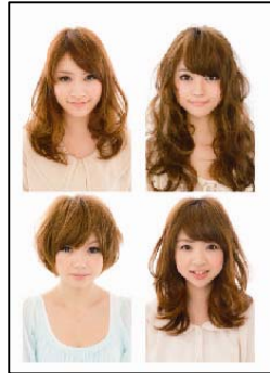
オススメのヘアスタイルを紹介