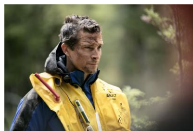
「ライフジャケットの使い方」