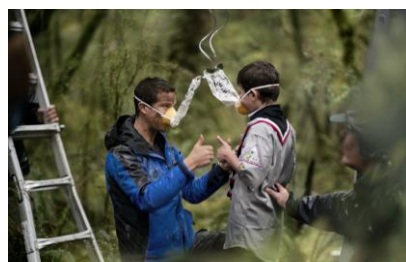
「ボーイスカウトの子どもと酸素マスクの装着を確認」