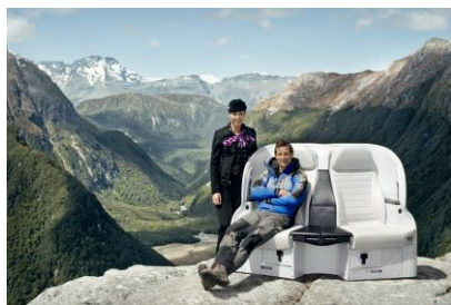
「岩山にシートが出現！」

ニュージーランド航空は、1940 年に設立された国際航空会社です。ニュージーランド国内をはじめ、アジア太平洋を含む 16 ヶ国 53 都市へ直行便を運航し、スターアライアンスに加盟しています。日本路線では成田ーオークランド、関空ーオークランドの直行便を運航する唯一の航空会社です。同社は、2012 年 1 月にエア・トランスポート・ワールド誌「エアライン・オブ・ザ・イヤー」の二度目の受賞を果たしています。