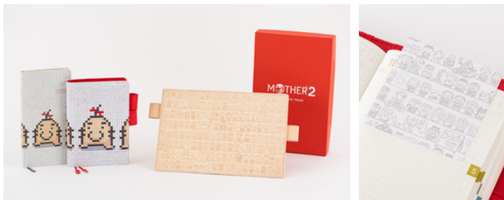
▲左から「タイルのどせいさん [weeks]」「タイルのどせいさん [オリジナル]」「CAST (Leather ver.) [オリジナル]」。「CAST (Leather ver.)」には、オリジナルの赤い箱もつきます。▲2020年版の『MOTHER2』シリーズの手帳には、「MOTHER2のふせん(接着面多め)」のおまけつき。

糸井重里が手がけたゲーム『MOTHER2』とのコラボレーションカバー。オリジナル、weeksの「タイルのどせいさん」は、実際に小さなタイルを一つひとつ組み合わせることで、人気キャラ「どせいさん」の持ち味を立体的に表現。そのタイルを撮影してプリントカバーにしたという、凝った作りをしています。4体のどせいさんそれぞれの表情をおたのしみください。さらに、2016年版で大人気だったプリントカバー「CAST」の革バージョンも登場。『MOTHER2』の登場人物たちがざらりと並ぶ様子を革の型押しで表現しました。キャラクターがそのまま飛び出してきたような緻密な仕上がり、そしてヌメ革ならではの、革が色濃く育っていくのも魅力です。