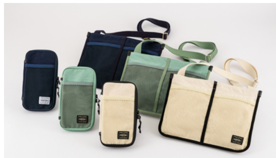
▲左前から「Go Out (ネイビー/ミントグリーン/ホワイト) [weeks カバー]」「Go Out サコッシュ (ネイビー/ミントグリーン/ホワイト)」

「BEAMS」と「吉田カバン」によるブランド「B JIRUSHI YOSHIDA」と作った weeks 専用のカバー「Go Out」。カバーの表側にはスマートフォンがすっぽり入る大きさのメッシュ状のポケットがあります。目の粗いメッシュで、中に入れたものがちらりと見えます。「ホワイト」はナチュラルな生成り色で、どんなスタイルにも似合うスタンダードなカラー。「ネイビー」は落ち着きのある紺色で、どんなシーンにもなじむ色合い。「ミントグリーン」は、ファッションのワンポイントにもなりそうなカラー。手帳カバーとおそろいの3色で作った「Go Outサコッシュ」も、ほぼ日手帳公式サイトで同時発売します。