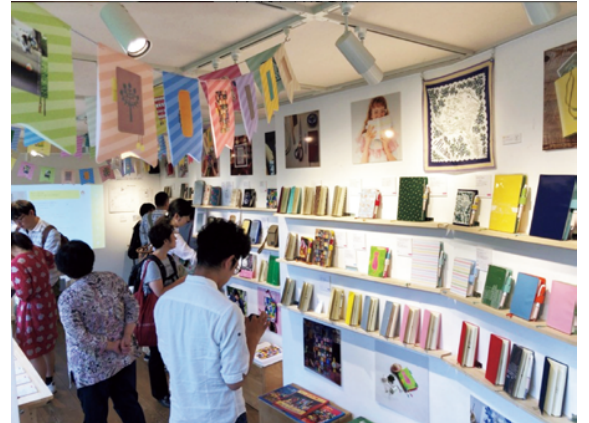
▲2018年のようす。抽選販売のカバーやほぼ日手帳公式サイト限定のアイテムも手にとってさわられます。