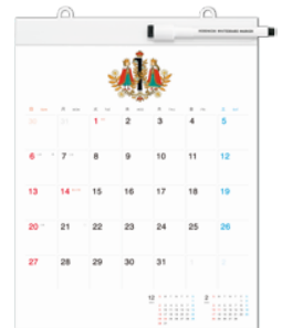
ミディアムサイズ 縦 310mm×横 240mm 2,100 円+税