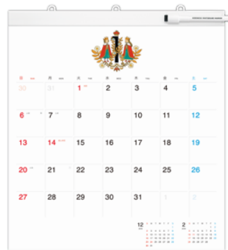
フルサイズ 縦 438mm×横 395mm 2,600 円+税

予定、メモ、伝言など、何でもたっぷり書き込むことができ、何回でも消せるカレンダー「ほぼ日ホワイトボードカレンダー 2020」も2019年9月1日(日)より発売します。機能性とデザインで選ばれて、2019年版では約65,000部を販売。全国ロフトのカレンダー売場では14年連続で売上1位を記録しています。2020年版の「ほぼ日ホワイトボードカレンダー」では、フルサイズ、ミディアムサイズ、卓上サイズに加え、糸井重里の愛犬「ブイコ」の写真を使った「気まぐれカレンダー」が帰ってきました。