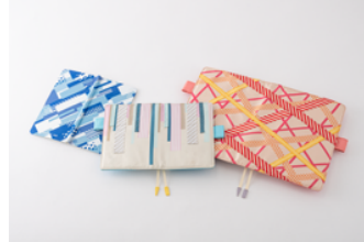
▲左から「blue mix [weeks]」「pastel mix [オリジナル]」「red×yellow mix [カズン]」

世界20カ国以上で愛されるマスキングテープ (Washi Tape) のトップブランド「mt」と一緒に、マスキングテープの魅力に形にした手帳カバーを作りました。オリジナルの「pastel mix」は、さまざまな柄のマスキングテープを並べて貼ったようなデザイン。カズンの「red×yellow mix」は、赤や黄色のマスキングテープを大胆に貼ったイメージ。オリジナルとカズンは、マスキングテープを重ね貼りした感じが出るように、織りで表現した生地に織りで作ったテープを縫いつけています。weeksの「blue mix」は、さまざまな柄の青と白のマスキングテープを敷き詰めたようなデザイン。生地の織りでマスキングテープを表現しました。