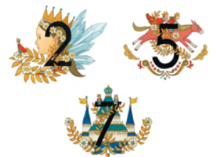
卓上サイズ 縦 172mm×横 177mm 1,500 円+税

▲2020年版の「月の数字」は画家・絵本作家のjunaida(ジュナイダ)さん描き下ろし。