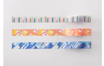
▲「mt」シリーズの発売を記念して、手帳とおそろいの柄のマスキングテープを作りました。太さは定番の15mm幅。