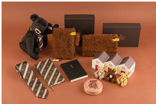
▲左上から「チョコレート・テディ(トリニティ仕様) [オリジナル]」「おさいふテディ [weeks カバー]」「よそいきテディ [weeks]」「手帳本体 Planner (シュタイフバージョン)」ほか関連アイテムも充実。

ドイツのぬいぐるみメーカー「シュタイフ」と、3年めのコラボレーション。オリジナル「チョコレート・テディ(トリニティ仕様)」は、チョコレートブラウンの巻き毛がかわいらしいテディベアみたいなカバー。今年のテーマ「トリニティ」に合わせて、しおりのチャームには3びきのクマ。「チョコレート、カフェオレ、ビスケット」の3色は同時発売のキーリングとおそろいです。weeksカバー「おさいふテディ(チョコレート)」もまた、シュタイフ社のベアと同じモヘア100%の生地を使用していて、長財布としても使える三つ折りタイプ。weeks「よそいきテディ(チョコレート)」はレジメンタルストライプにテディベアの顔が並ぶ、遊び心のある手帳。そして、さらなるスペシャルアイテムを10月末に発表する予定です。