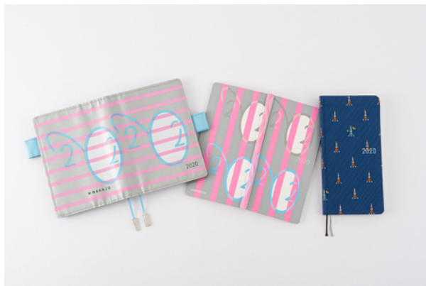
▲左から仲條正義「2020[オリジナル]」仲條正義「2020[weeks]」タイ&チーフ「東京タワー[weeks]」

世界からの注目を集める2020年を記念した、ほぼ日手帳ができました。オリジナル、weeksの「2020」は、グラフィックデザイン界の巨匠、仲條正義さんが「2020年」をモチーフにデザインしたものです。マットなシルバーに、シルクプリントで施された白・水色・ピンクのコントラストが映える、美しいカバーです。weeks「東京タワー」は、ほぼ日によるデザイン。ダークネイビーの表紙に、東京のシンボル「東京タワー」をネクタイ生地織りで表現したもの。オレンジと白のカラーリングは、展望台から上が7等分になるよう実物にあわせた配色です。よく見ると、ライトアップされた東京タワーも隠れています。