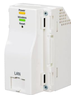
Wi-Fi AP Unit

マンションなどの各戸または各階に設置することにより、電波が壁や扉にさえぎられず良好な通信環境を実現。