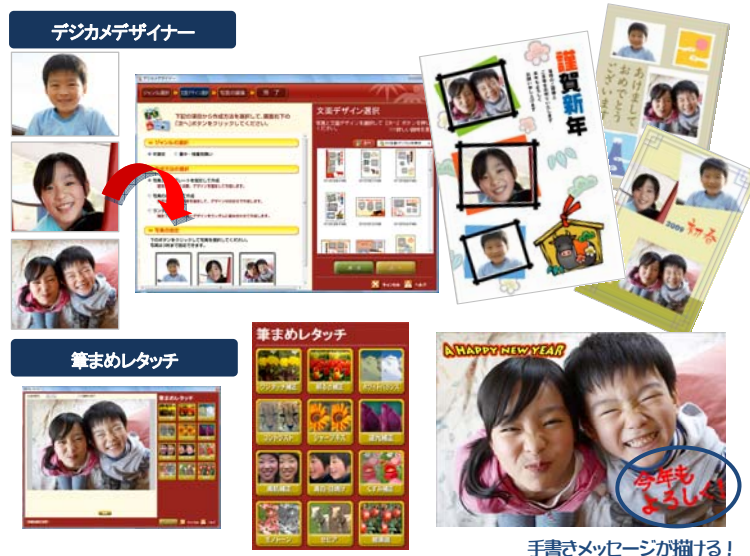
手書きメッセージが描ける！