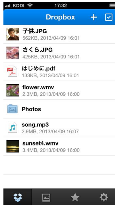
iPhoneアプリケーション