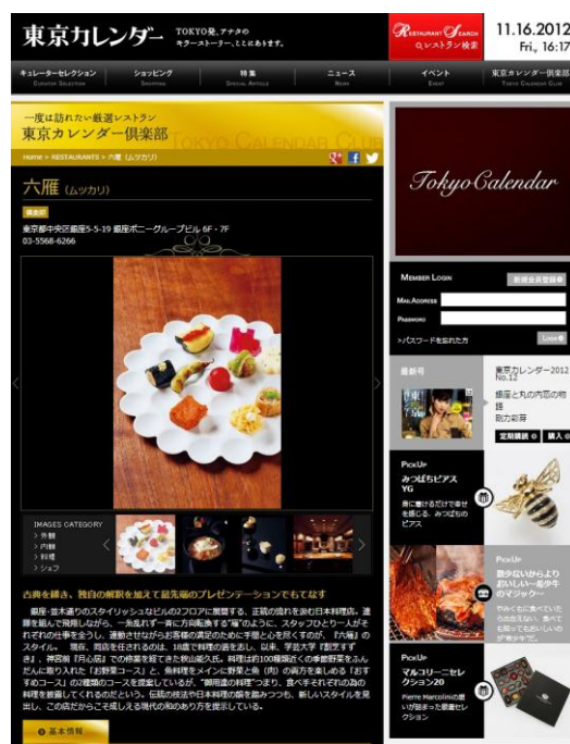
編集部が特に価値が高いと感じた、一度は訪れたい厳選レストラン