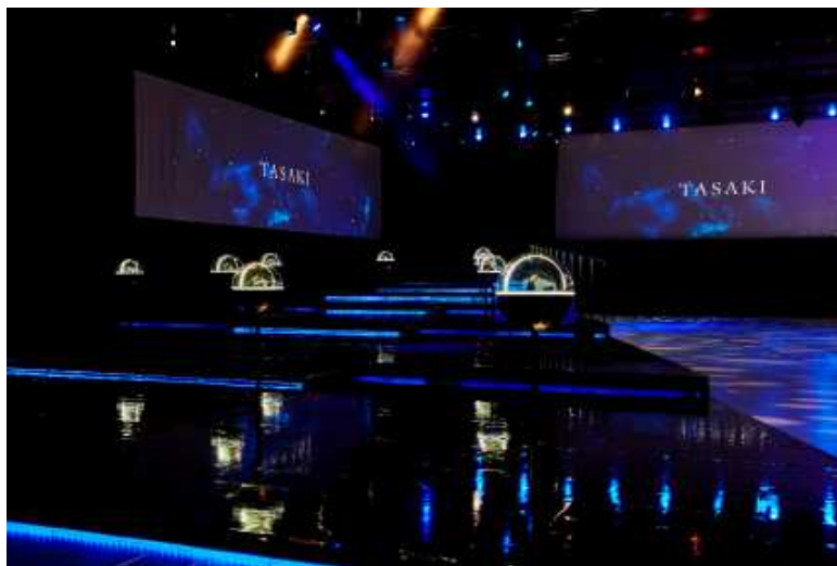
The venue image which "TASAKI TIMEPIECES" was displayed

TASAKI hopes you will enjoy the modern and sophisticated world of high jeweller TASAKI with the launch of its luxury watch collection, "TASAKI TIMEPIECES" and latest jewellery collection, "Curiosity".