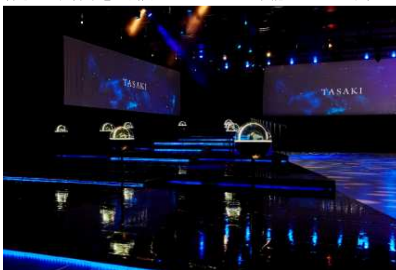
「TASAKI TIMEPIECES」が展示された会場の様子

高級腕時計コレクション「TASAKI TIMEPIECES」と、新作ジュエリーコレクション「Curiosity」の登場により、ハイジュエラーTASAKI のモダンで洗練された世界観をより幅広いアイテムでご堪能いただけます。