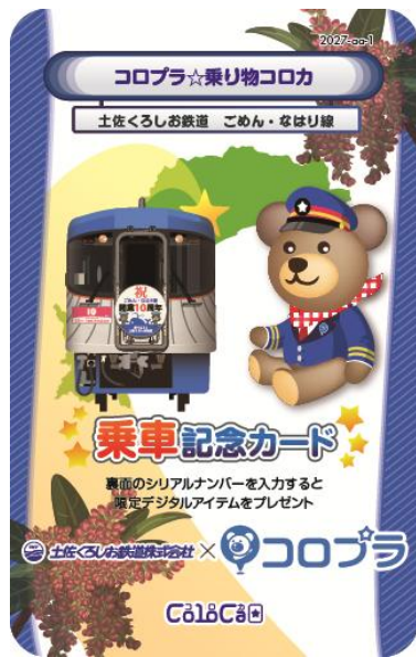
【土佐くろしお鉄道 ごめん・なはり線】