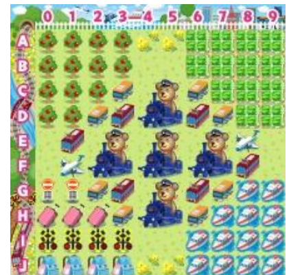
【乗り物コロカ旅なテーマ[昼]】

乗り物コロカ裏面のシリアル番号をコロニーな生活内でユーザが入力すると、各社オリジナルデザインのデジタルアイテム「●●●の模型」を獲得することができます（アイテム名が一部異なる交通事業者がございます。詳細は各交通事業者にお問い合わせください）。さらに「乗り物コロカ」入力で、各社ごとに用意された「デジタルスタンプラリー」に参加できます。指定された駅や観光地、デジタル上のお土産を集めるミッションをクリアすると、クリア数に応じて限定デジタルアイテム「乗り物コロカ旅なテーマ[昼][夕][夜]」や「乗り物コロカ旅金貨」などを獲得することができます。