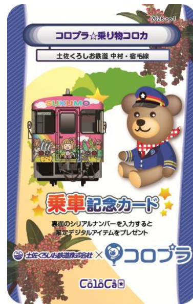
【土佐くろしお鉄道 中村・宿毛線】