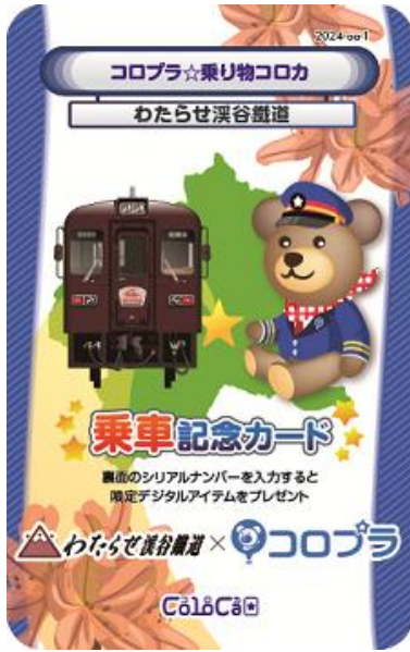
【わたらせ渓谷鐵道】