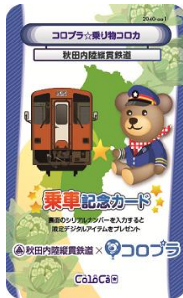
【秋田内陸縦貫鉄道】