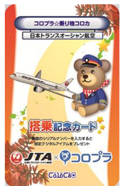
【日本トランスオーシャン航空】