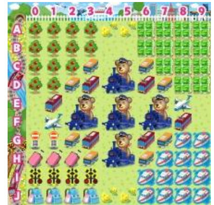
【乗り物コロカ旅なテーマ[昼]】

乗り物コロカ裏面のシリアル番号をコロニーな生活内でユーザが入力すると、各社オリジナルデザインのデジタルアイテム「●●●の模型」を獲得することができます（アイテム名が一部異なる交通事業者がございます。詳細は各交通事業者にお問い合わせください）。さらに「乗り物コロカ」入力で、各社ごとに用意された「デジタルスタンプラリー」に参加できます。指定された駅や観光地、デジタル上のお土産を集めるミッションをクリアすると、クリア数に応じて限定デジタルアイテム「乗り物コロカ旅なテーマ[昼][夕][夜]」や「乗り物コロカ旅金貨」などを獲得することができます。