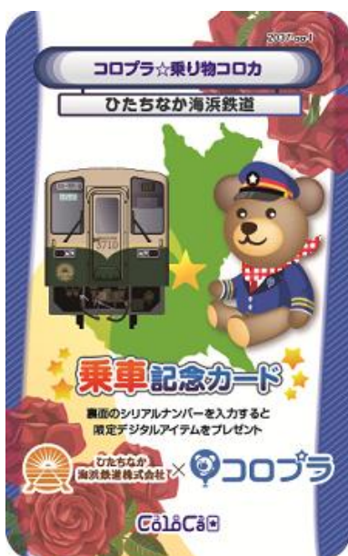
【ひたちなか海浜鉄道】