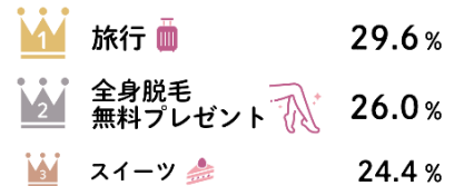
特にもらって嬉しいものは？（複数回答）

4 現在、恋人・パートナーがいる女性のうち、72.4%はパートナーから「全身脱毛無料プレゼント」をもらえると「嬉しい」という意外な結果に！