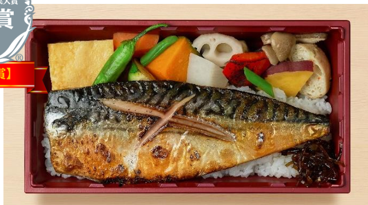
築地 千鶴屋「熟成漬け焼き弁当 鯖 <1,000 円（税込）>」