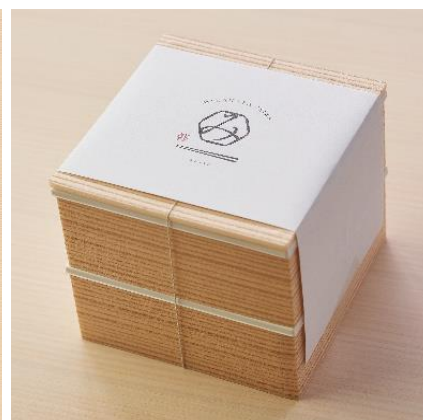
三河屋青果「お肉弁当 <1,000 円（税込）>」