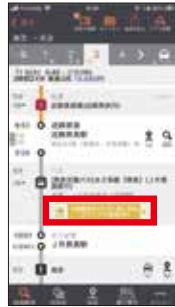
「フリーパス販売中」