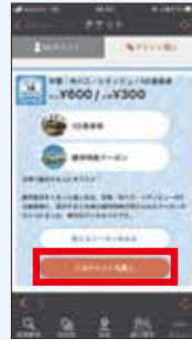
「このチケットを購入」