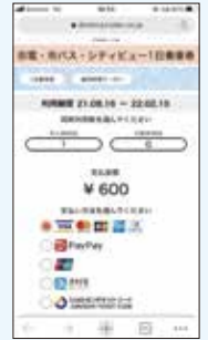
「決済/必要情報入力」