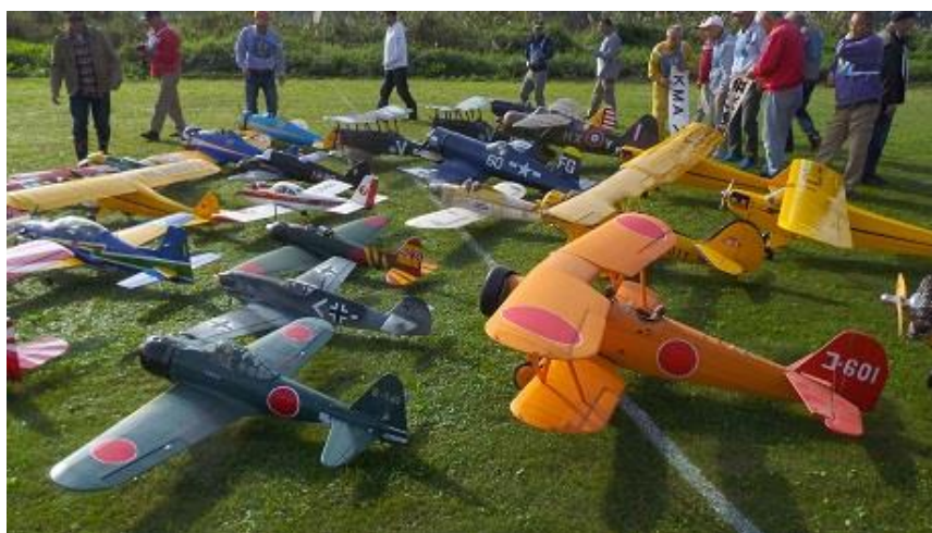
[展示予定の模型航空機(一例)]

全長3.6m・全幅4.4mの大型機を始め、約60機のラジコン模型航空機を一堂に展示します。