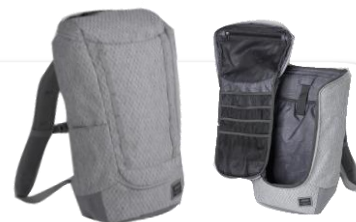
フルオープン構造