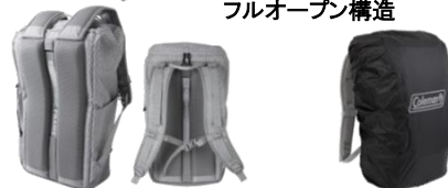
疲れにくいエルゴのミックフレーム レインカバーを内蔵