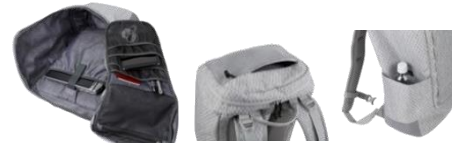
充実の各種オーガナイザーポケット

本広報資料に関する製品画像データは、「製品画像データの取扱いに関する注意事項」をご一読の上、下記 URL からダウンロードしてください。