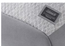
洗練された生地パターン

ダイヤモンドパターンが新鮮なヘザー生地×高級感のあるPUレザー。そのスリムなフェイスから一見してわかる洗練されたデザイン。定番のブラックと目を惹く新色グレーをラインナップした街づかいにフィットする新アウトドアバッグです。