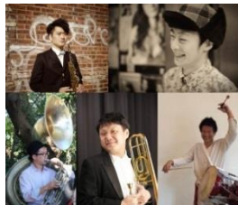
29日 Fanfare Arco Iris