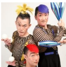
両日 くるくるシルク