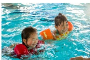
パドルジャンパー 子ども用 (目安年齢 3～6 歳)