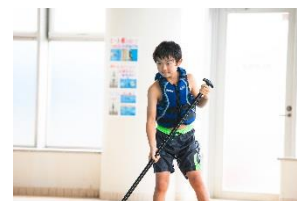
パドルジャンパー ユース ユース用 (目安年齢 7～11 歳)

・パドルジャンパー シリーズのウェブサイト: http://www.coleman.co.jp/puddlejumper/ ・動画を YouTube で公開中! https://www.youtube.com/watch?v=Tzs5eBHHZMA