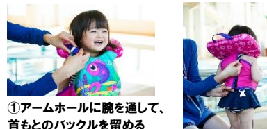
①アームホールに腕を通して、首もとのバックルを留める