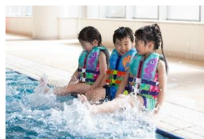
パドルジャンパー チャイルド 子ども用 (目安年齢 3～6 歳)