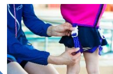
③足のストラップをつけて、ベルトの長さを調整