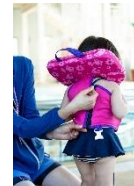
②背中ジッパーを上げる