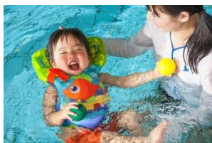
パドルジャンパー インファント 幼児用 (目安年齢 2～3 歳)