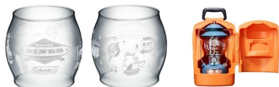
・オリジナルデザインのガラスグローブ ・クラムシェルキャリーケース

本広報資料に関する製品画像データは、「製品画像データの取扱いに関する注意事項」をご一読のうえ、以下 URL よりダウンロードしてください。 http://www.coleman.co.jp/company/pressroom/data/2016/2016-Coleman-SeasonsLantern2017.zip