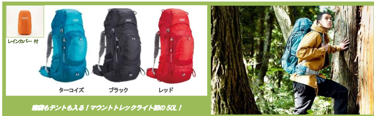
寝袋もテントも入る！マウントトレックライト初の50L！

コールマン ジャパン株式会社は、マウントトレックライトシリーズから新サイズの50L「マウントトレックライト50」を2014年3月下旬に発売します。